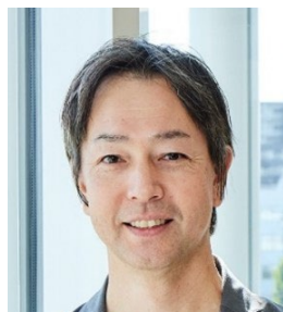
経営学部 経営学科 大学院 環境経営研究科 経営学専攻 教授