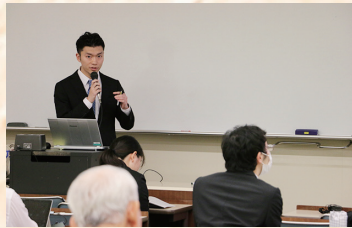
修士学位論文発表会の様子

環境学専攻の教育目標は、環境学だけでなく経営学の視点をもちながら、持続可能な社会の構築に向けて貢献できる人材を育成することです。また、地域資源の管理や保全について、現実即した有効で具体的な提案ができる人材育成をめざします。研究科共通科目である「環境経営科目群」に加えて、領域の専門性を高めるために「自然環境科目群」「資源循環科目群」「人間環境科目群」の3つの科目群を設置しており、学生自身の問題意識、研究テーマに応じて科目を選択します。各科目群は、地域の実際の問題に接し、その問題解決につながる提案や活動にむすびつく内容やフィールド活動を盛り込む講義内容となっています。また、必修科目として「特別演習」「特別研究」を設置し、学生自身の問題意識を育てて研究のテーマ追究を個人指導し、修士論文の作成に向けて取り組みます。