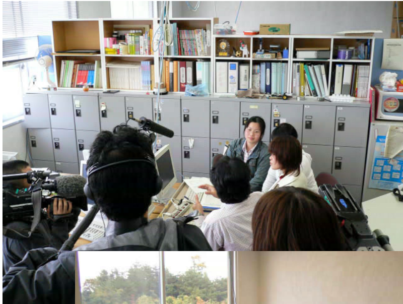
← 平成18年4月 NHKの取材を受けている フードマイレージ調査の様子