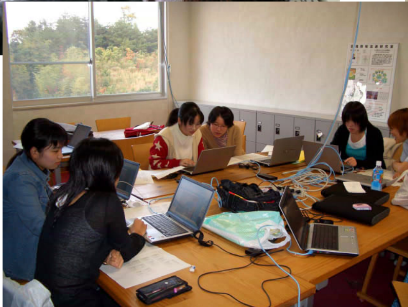
← 平成17年11月 ビデオを見ながら食べ残しの 量を調査